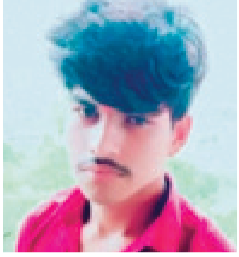
हरिभूमि न्यूज ▶▶ सारंगपुर

भाजपा नेता और सारंगपुर जनपद सदस्य ट्रांसपोर्टर का बेटा कार समेत कालीसिंध नदी में गिर गया। गोताखोरों और क्रेन की मदद से गाड़ी को तो निकाल लिया गया है, लेकिन युवक की तलाश की जा रही है। हादसा शुक्रवार सुबह करीब 4 बजे सारंगपुर पुराने एबी रोड कालीसिंध नदी के पुल पर हुआ। पुलिस ने कार नंबर एमपी -