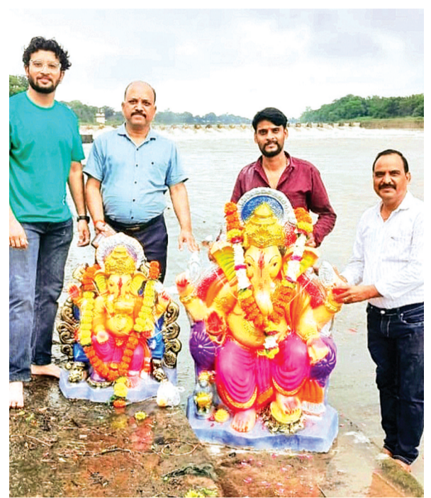
हरिभूमि न्यूज | नलखेड़ा

नगर में गणेश विसर्जन को लेकर इस बार बड़ों के साथ बच्चों में भी उत्साह दिखाई दिया। शनिवार को दस दिवसीय गणेशोत्सव का समापन गणेश प्रतिमाओं के विसर्जन के साथ हुआ। इस दौरान बच्चों में भी विशेष उत्साह दिखाई दिया। फिर चाहे घरों में स्थापित गणेश प्रतिमाओं के विसर्जन का हो या फिर सार्वजनिक पांडालों में स्थापित प्रतिमाओं के विसर्जन का हो। जहाँ घरों में स्थापित प्रतिमाओं को बच्चों सिर पर धारण कर विसर्जन स्थल पर जाते दिखाई दे रहे थे, वहीं सार्वजनिक पांडालों की प्रतिमा विसर्जन के लिए ट्रेक्टर ट्रॉली अथवा किसी अन्य वाहन को सजाने से लेकर चल समारोह के आगे आगे नाचते चलने तक बच्चों में विशेष उत्साह दिखाई दे रहा था। बच्चे अपने प्रिय भगवान को गणपति बप्पा मोरिया अगले बरस तू जल्दी आ के जयघोष से वातावरण गुंजायमान कर रहे थे।